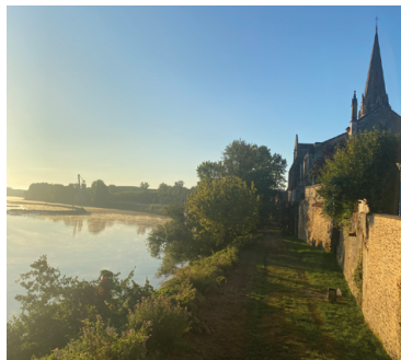
Promenade vers le Port de Langon