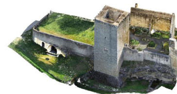
3D des remparts - Rions