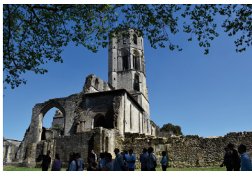
Abbaye La Sauve Majeure