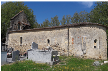
Chapelle Tersac - Meilhan-sur-Garonne