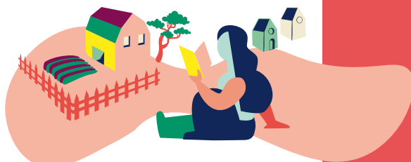
Château de Villandraut

Détails des animations et renseignements par téléphone au 05 56 25 87 57 ou par mail à asso.adichats@gmail.com